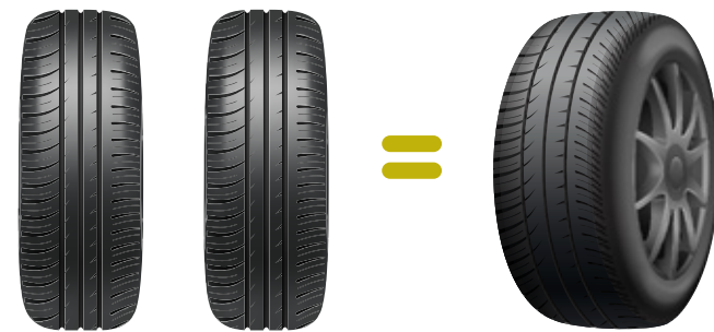
Figura 1. Comparación de par de neumáticos gemelos con neumáticos de base ancha.

Al igual que con los neumáticos convencionales, existen diferentes tipos de neumáticos super anchos, los que pueden ser compatibles con diferentes ejes del camión y poseer bandas con o sin baja resistencia a la rodadura. En ambos casos se observan ahorros en el consumo de combustible.