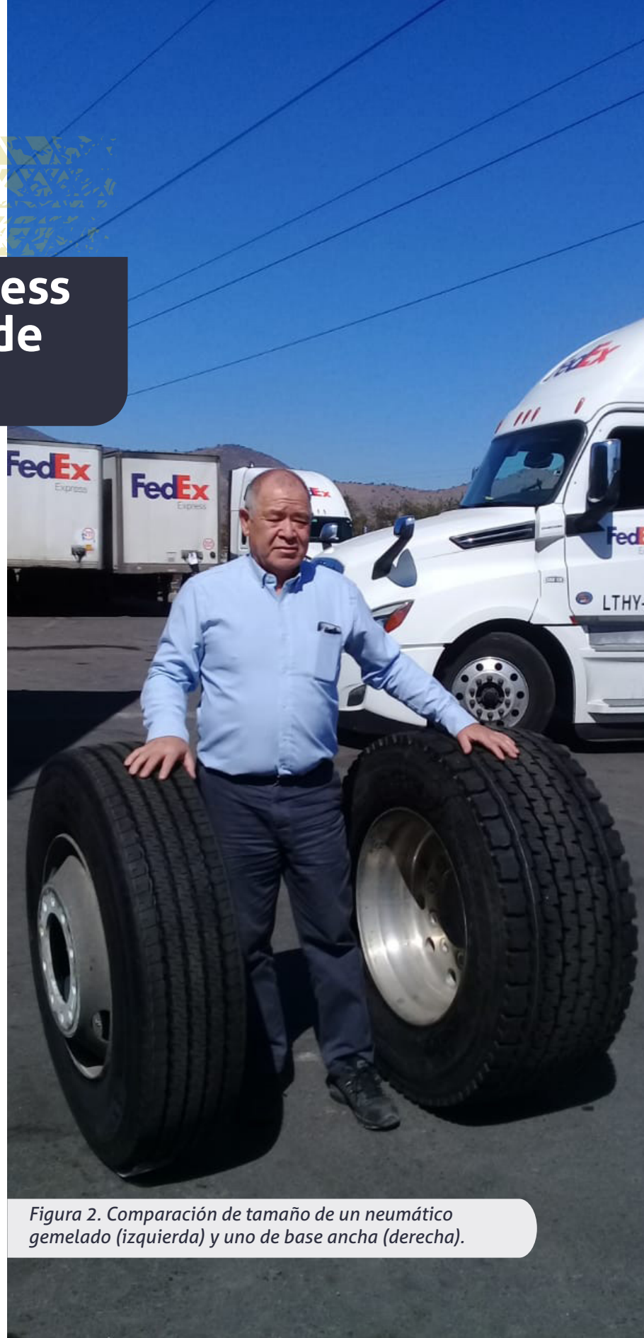
Figura 2. Comparación de tamaño de un neumático gemelado (izquierda) y uno de base ancha (derecha).

La normativa chilena establece un límite de peso por eje. El peso permitido por eje en el tándem baja de 18 a 14 toneladas al pasar de neumáticos dobles a neumáticos de base ancha. En